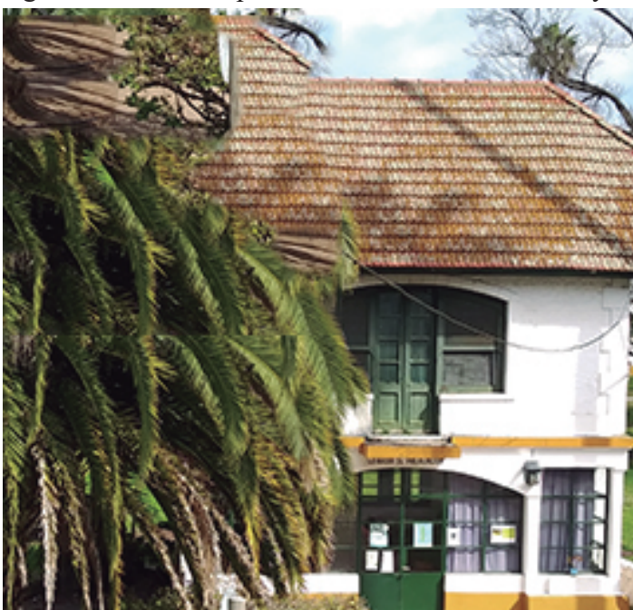
Guardia de Prevención, ex lavadero de la estancia.

En la época de la estancia, este edificio de dos plantas funcionaba como lavadero de la familia Pereyra Iraola. Fue construido a principio del Siglo XX y en él se encuentra hoy la Guardia de Seguridad de la escuela. Se trata de uno de los puntos de bienvenida de oficiales, cadetes y visitantes pese a que, antiguamente, el ingreso se realizaba por el lado de la estación Pereyra.