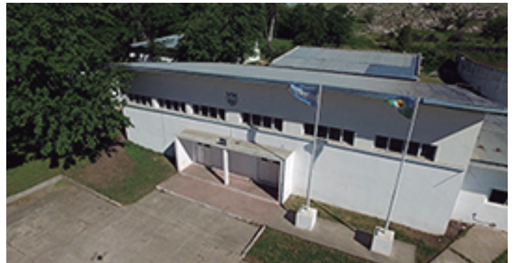
Edificio de la escuela de Olavarría

Sus estudiantes se identifican con los valores y objetivos delineados por la Institución y se comprometen a dar el mejor esfuerzo para superar los obstáculos que se les presentan. La escuela sigue siendo una vía insustituible para lograr objetivos valiosos en sociedades que defienden principios de participación y justicia social, bajo un marco de responsabilidad plena en el proceso de formación comprometido con la organización democrática.