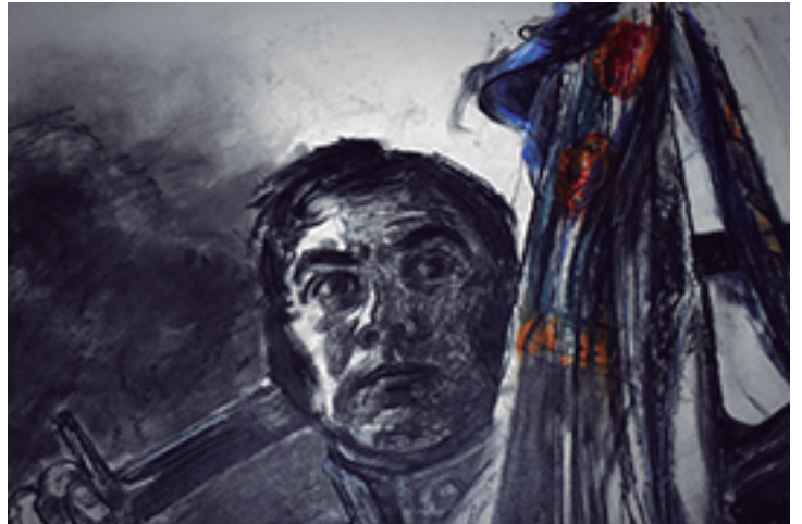
Fragmento del San Martín Guerrero. Técnica Carbón y Pastel de Guillermo Roux

Como tantos otros artistas que no fueron contemporáneos a sus obras, San Martín dejó una pintura que sólo podrían comenzar a entender e interpretar años más tarde. Entre los bosquejos y líneas de su lienzo independentista, dejó plasmado el mensaje para las nuevas generaciones de argentinos, a quienes directa e indirectamente los llamó para hacerse responsables de cumplir con su misión en la historia y continuar su legado. Es nuestro tiempo, es momento de terminar de una vez y para siempre con las divisiones y hermanarnos detrás de un sentimiento que supere toda barrera. Es hora de honrar a nuestro padre, es hora de hacer Patria!