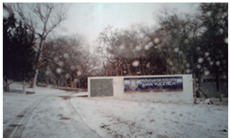
Entrada a la escuela con nieve