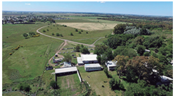
Toma aérea del predio