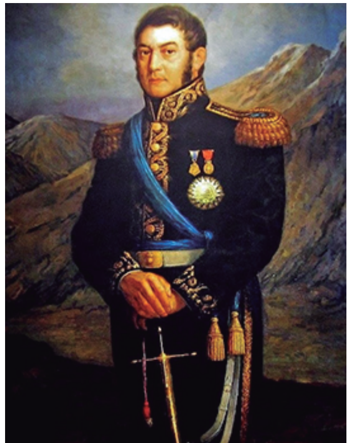
Oleo del General José de San Martín

La situación se tornaba cada vez más complicada debido al malestar social y político en las tierras peruanas, por eso es que se reunió con Simón Bolívar para definir el futuro del continente. El General caraqueño era quien llevaba a cabo la lucha en el norte de Sudamérica. En la entrevista de Guayaquil los dos libertadores plantearon sus nuevas ideas y el General San Martín decidió dar un paso al costado por entender que su presencia no era necesaria para la finalización de la campaña emancipadora, y por la negativa de Bolívar de que sea su segundo al mando.