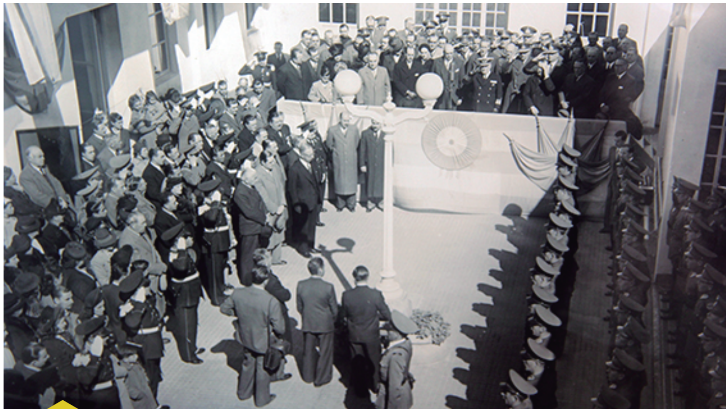
16 DE AGOSTO DE 1941- ACTO DE APERTURA DE LA ESCUELA

Pese a que la escuela se creó por decreto el 27 de junio de 1941, las clases comenzaron el 16 de agosto en un edificio ubicado en Avenida 1 Nro. 527 de la ciudad de La Plata. En esta fotografía vemos la ceremonia de inauguración.