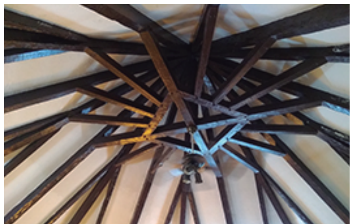
Interior con tirantes de pinotea rusa.