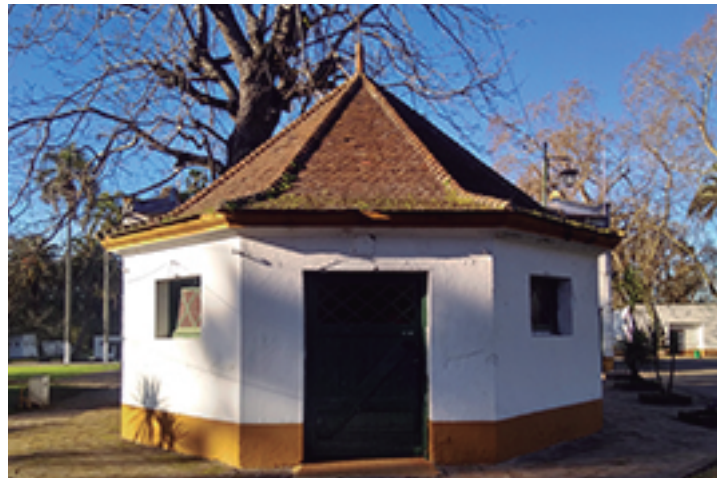
Construcción con forma octogonal.